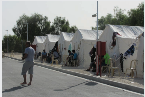
Πρώτη Υποδοχή Μεταναστών