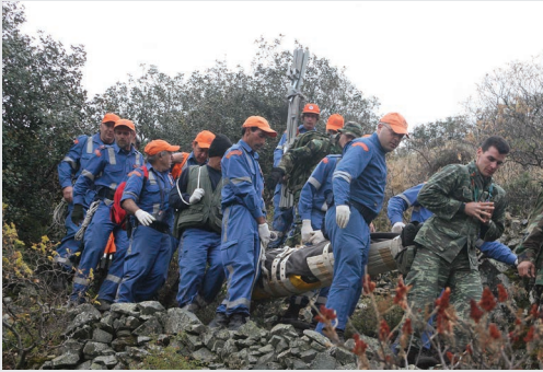
Ανεύρεση Ελλειπόντων Προσώπων