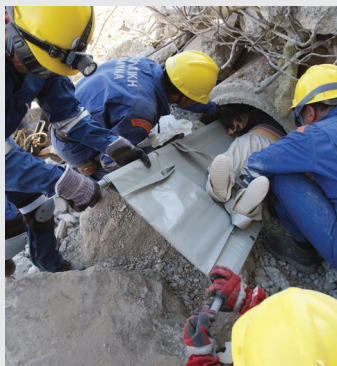
Διάσωση μέσα από Ερείπια