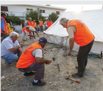
Εκκένωση Κατοικημένων Περιοχών

Η Πολιτική Άμυνα λαμβάνει μέρος σε κινητοποιήσεις όπως κατάσβεση πυρκαγιών, εκκένωση κατοικημένων περιοχών, άντληση νερών από πλημμυρισμένα υποστατικά, ανεύρεση ελλειπόντων προσώπων, διάσωση ατόμων από ερείπια, πρώτη υποδοχή ατόμων που χρήζουν διεθνούς προστασίας-άτυποι μετανάστες κ.ά.