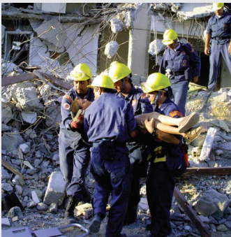
Σχέδια Διαχείρισης Κινδύνων